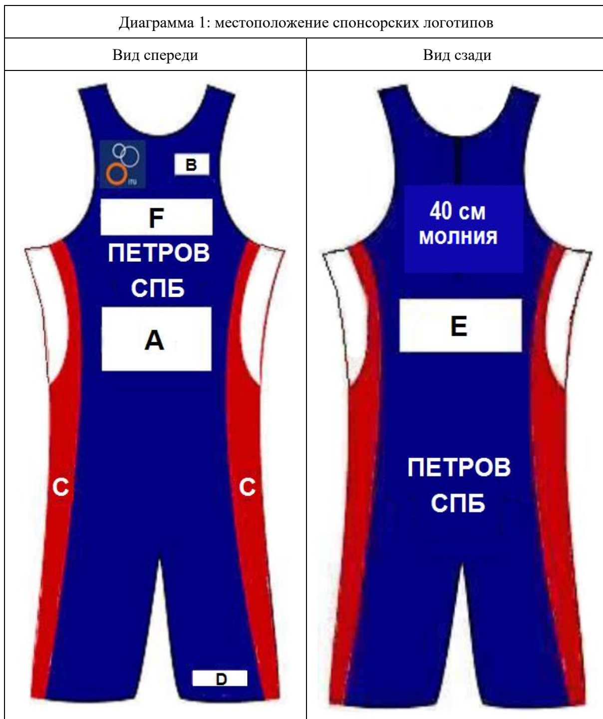
Диаграмма 1: Местоположение мест для спонсора

25.4.1. Стартовая форма должны иметь цвета, выбранные региональной спортивной федерацией для всероссийских соревнований по триатлону.